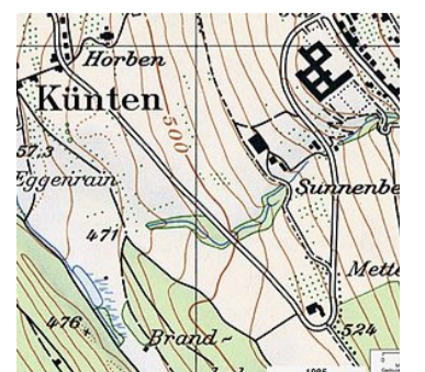
Neckisch: Die nackte Frau bei Künten AG.