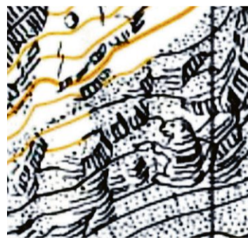
Legendär: Das Murmeltier im Fels über dem Aletschgletscher.

«Wer die Frauenfigur bei Künten in der Landeskarte eingebaut hat, ist nicht bekannt», sagt Hurni. Es sei heute auch nicht mehr nachvollziehbar, ob es ein Zufall war «oder einfach ein bisschen plastische Chirurgie». Da die Landeskarte auf Basis des neu-