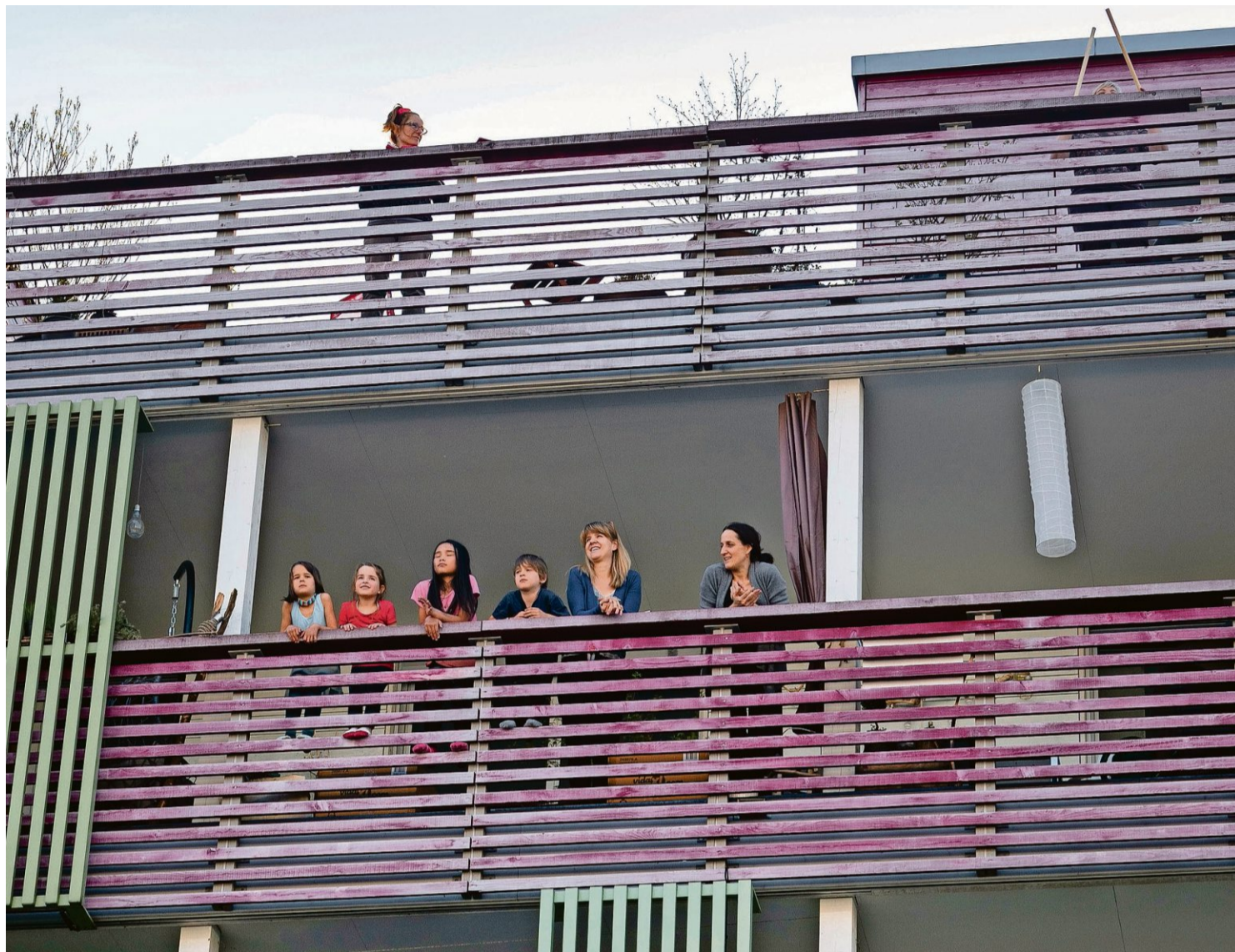
Giesserei Oberwinterthur: Um 18 Uhr abends gibt es ein Balkonkonzert, bei dem die Singenden zugleich das Publikum sind.

Auf einem Balkon stehen zwei ältere Menschen nahe beieinander und schauen hinab in den romantisch wild bepflanzten Hof, in dem es zu grünen beginnt. Bei